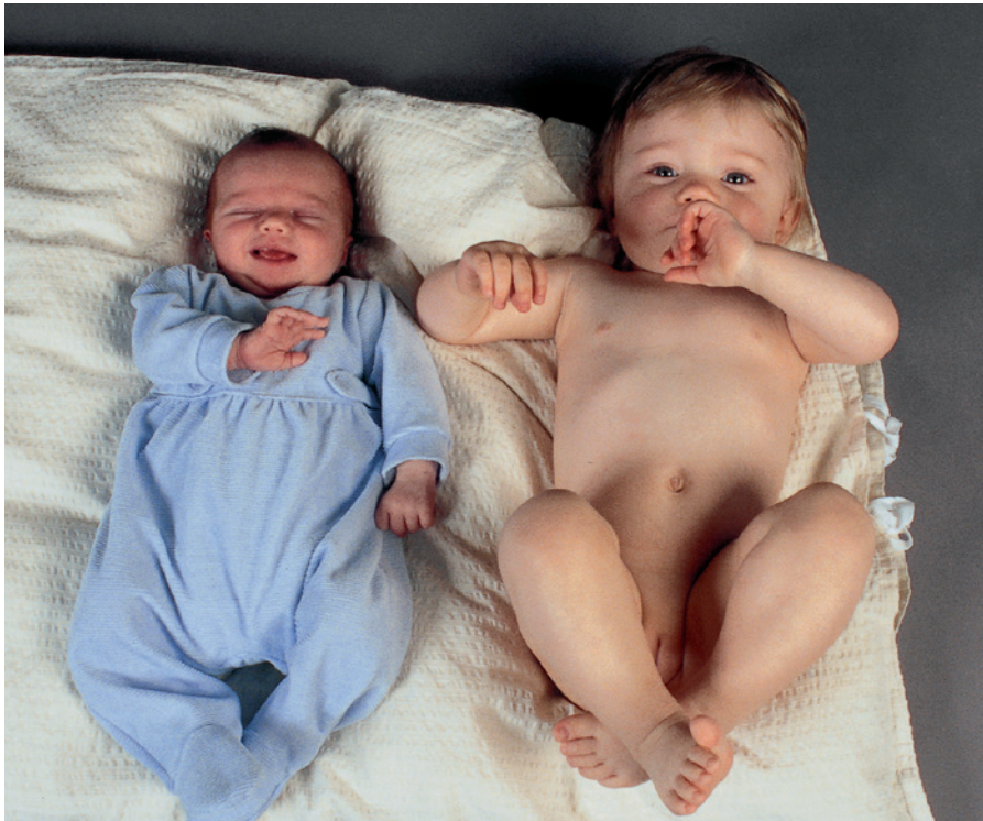
Væksthastigheden er meget høj det første leveår.

man skal intervenere, og hvornår der skal henvises fra sundhedsplejerske til egen læge eller fra egen læge til børneafdeling er beskrevet i detaljer i Monitorering af vækst hos 0-5-årige børn. Vejledning til sundhedsplejersker og praktiserende læger (Sundhedsstyrelsen 2015). Det er vigtigt, at målingerne plottes ind på en vækstkurve, og at det er den samlede vækst, der vurderes.