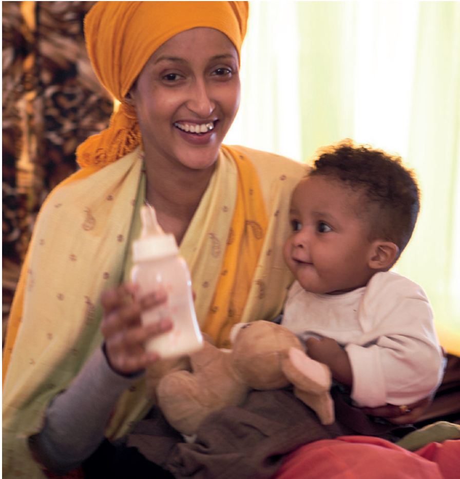
Overgangskosten suppleres her med modermælkserstatning.