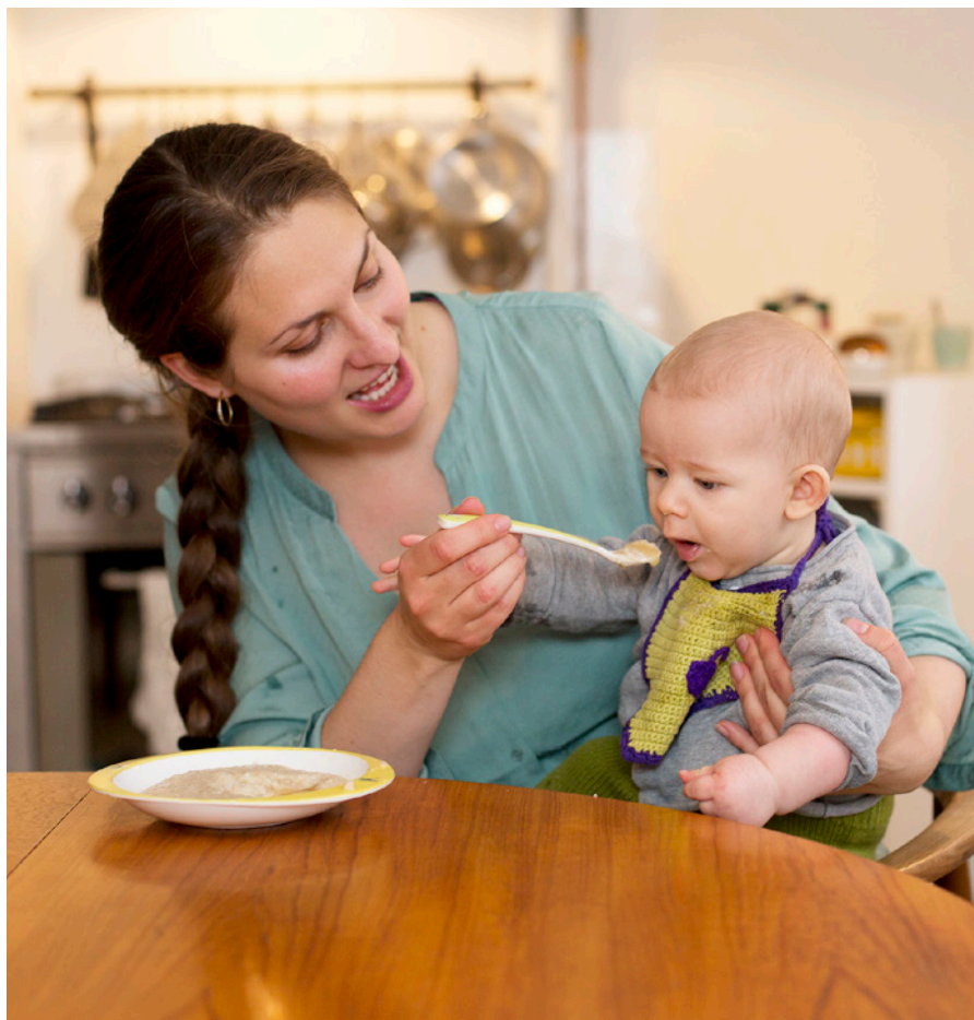
Hjemmelavet grød med lidt frugtmos er god at starte dagen på.

barn og fra måltid til måltid. Det kræver, at forældrene er opmærksomme, tålmodige og i stand til at aflæse spædbarnets signaler på om det fx er sultent, mæt, træt eller har brug for en pause som beskrevet i afsnit 2.1.1.